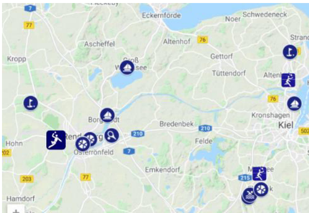
Bild: Karte inklusiver Angebote

Der Kreissportverband möchte sich verstärkt für die selbstverständliche Teilnahme und Teilhabe möglichst aller Menschen im Sport einsetzen. Durch die Aufnahme in das KSV