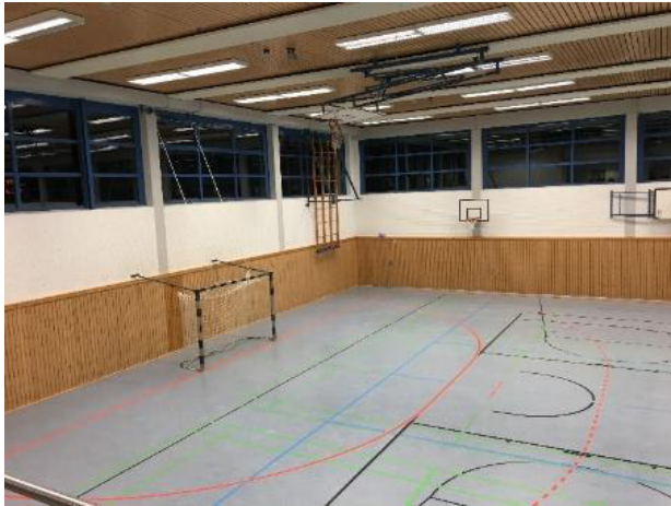
Foto: Leere Sporthallen während der Pandemiezeit

Die Corona-Pandemie hat den Sport in den letzten zwei Jahren stellenweise fast zum Erliegen gebracht. Leere Turnhallen, Fußballplätze, auf denen keiner gespielt hat