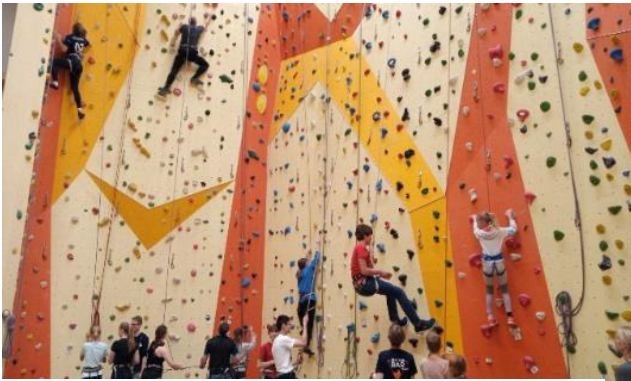
Foto: Team-Event in der KletterBar

rund 35 Kindern und Jugendlichen hoch hinaus in der KletterBar in Meldorf, wo sich die Teilnehmer in Kleingruppen an den bis zu 16 Meter hohen Wänden austoben konnten.