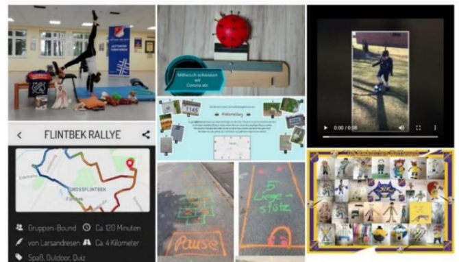
Bild: Kreative Ideen der Vereine gegen Corona-Langeweile

Die Corona-Pandemie hat die Jüngsten besonders hart getroffen. Gerade für die Kinder ist es so wichtig, dass Kitas, Schulen, Sportangebote und Jugendeinrichtungen offen sind und offen bleiben. Unsere Sportvereine haben dazu viele (digitale) Angebote geschaffen, um insbesondere in Zeiten der Lockdowns für ein wenig Abwechslung zu sorgen. Dieses Engagement hat die Kreissportjugend finanziell unterstützt und im Rahmen eines Wettbewerbs zehn Vereine gesucht, die sich in Zeiten von Corona kreative Lösungen ausgedacht haben, um Kinder und Jugendliche in Bewegung zu bringen.