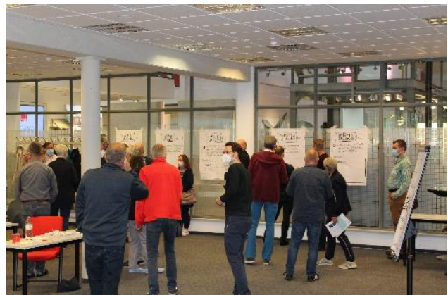
Foto: Austausch und Ideensammlung der Teilnehmer des Workshops

Aus den gesammelten Ideen wurden erste Maßnahmen und Umsetzungsschritte abgeleitet und für die weiteren Aktivitäten dokumentiert.