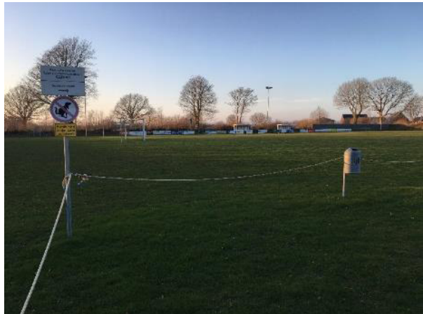
Foto: Sportplatz ohne Sportbetrieb

Zusätzlich wurden als Reaktion darauf in den letzten zwei Jahren u.a. Videokurse und Online-Angebote von den