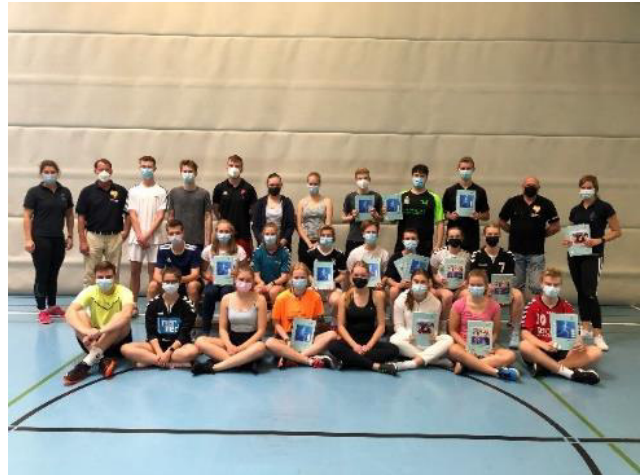
Foto: Der neu gestartete C-Lizenz Kurs des Helene-Lange Gymnasiums (2021)

Der hohe Bedarf, neue Übungsleiter und Trainer zu gewinnen, hat sich bereits in dem kreisweiten