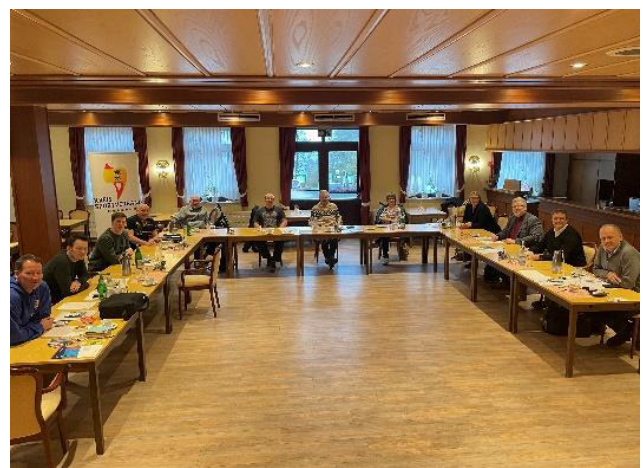
Foto: Klausurtagung des KSV Vorstand und Beisitzer

Am letzten Januarwochenende 2022 versammelte sich der KSV Vorstand mit seinen Beisitzern in den Tagungsräumen des Hotels Wittensee Schützenhof zur Klausurtagung, um mit Blick auf die vergangenen Jahre, die Zukunftsstrategien für das Jahr 2022 zu entwickeln. In dieser zweitägigen Maßnahme wurden die Schwerpunkte der Sportperspektive 2025 (vgl. oben) intensiv weiterentwickelt und konkrete Arbeitspakete geschnürt.