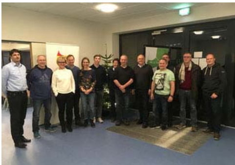
Teilnehmer des Sportdialogs in Fockbek

Am 03.12.2019, versammelten sich 15 Vereinsvertreter in der neuen Harald-Striewski-Halle des SV Fockbek, um sich über aktuelle Themen, wie Übungsleitermangel, ehrenamtliches Engagement und Sporttrends auszutauschen. Die anwesenden Vereine vertraten dabei rund 50% aller Sportvereinsmitglieder aus dem Amt Fockbek.