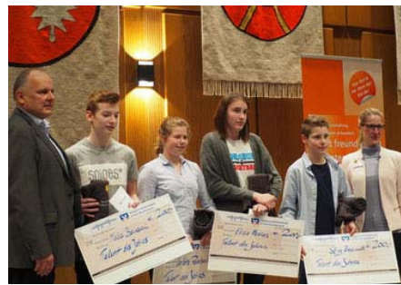
Talente des Jahres 2018

Bei den Ehrungsveranstaltungen 2018 und 2019 wurden insgesamt 227 Sportler geehrt. 28 Personen erhielten Auszeichnungen aufgrund Ihres außergewöhnlichen ehrenamtlichen Engagements im Sport. Zusätzlich wurden 9 Sportler in der Kategorie „Talente des Jahres“ in Kooperation und mit finanzieller Unterstützung durch die Volksbank – Raiffeisenbank im Kreis Rendsburg ausgezeichnet.