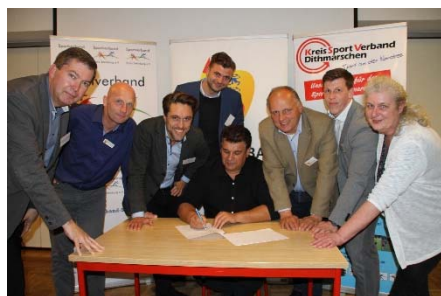
Unterzeichnung des Kooperationsvertrages

Vor diesem Hintergrund haben sich die Kreissportverbände Dithmarschen und Rendsburg-Eckernförde sowie der Sportverband Kreis Steinburg, deren Mitgliedsvereine sich zu einem hohen Anteil im ländlichen Raum befinden, auf eine stärkere Zusammenarbeit verständigt. Als Pilotprojekt soll eine kreisübergreifende Sportentwicklungsplanung für 38 Kommunen in den ländlich geprägten Ämtern Mittelholstein, Mitteldithmarschen und Schenefeld angestoßen werden, um die Rahmenbedingungen von Sport und Bewegung auf Basis der Bedarfe der Bevölkerung, der Vereine, der Schulen und anderer Einrichtungen zu sichern und zu verbessern. Mit der Durchführung wurde das Potsdamer Institut für kommunale